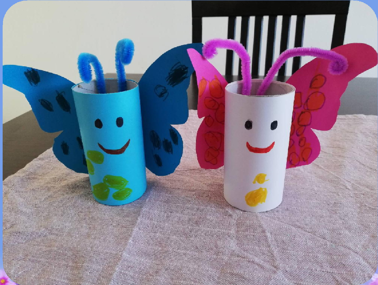
MARIN I AURORA