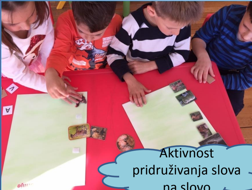
Aktivnost pridruživanja slova na slovo