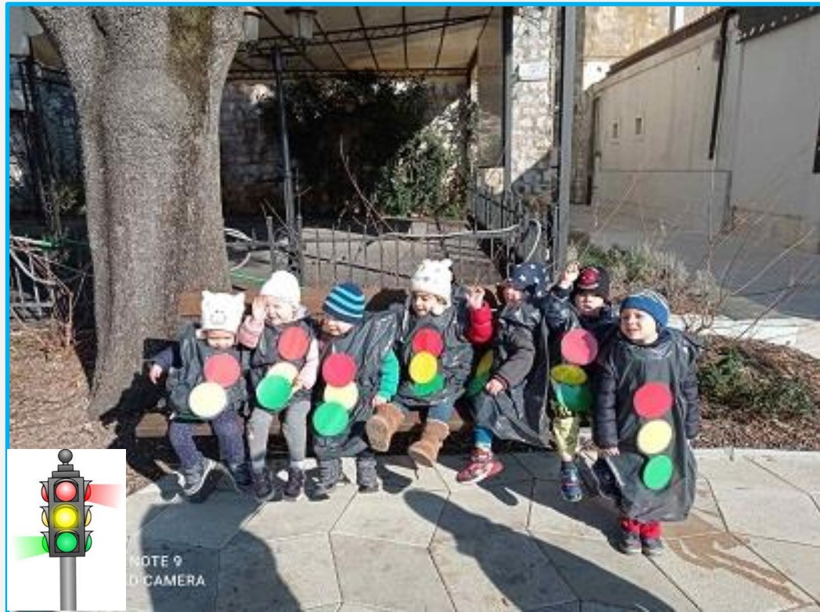
„Prometni znakovi” u prometu