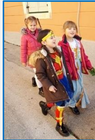
Volimo maškare, ali i naš grad kojem se predstavljamo!