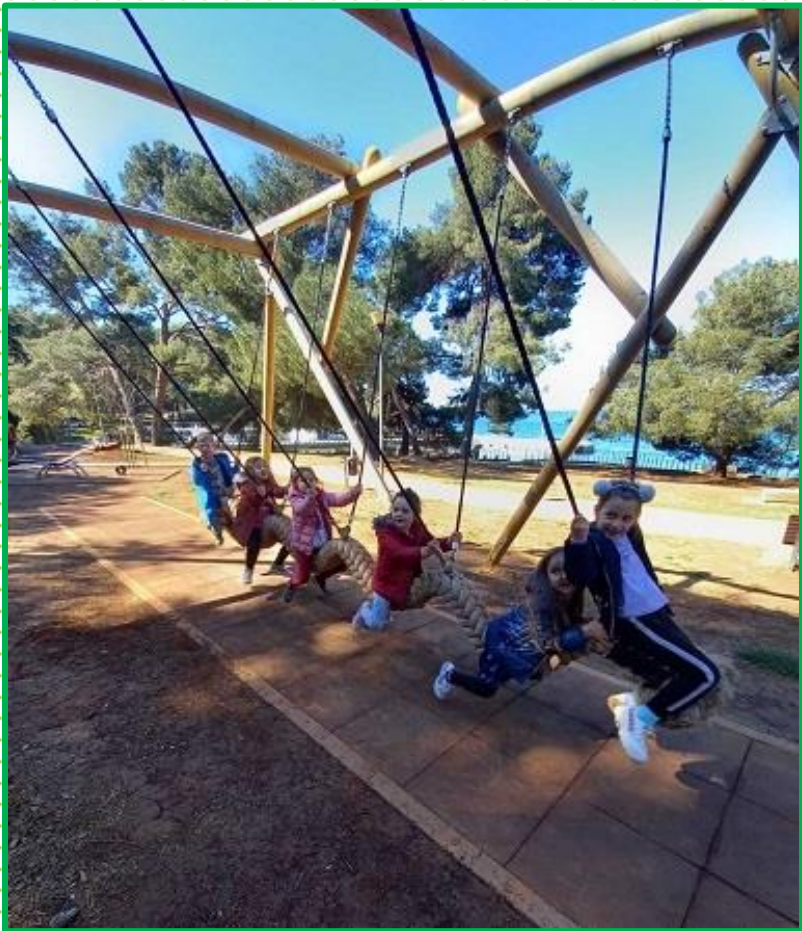
Igre na zraku i na spravama.