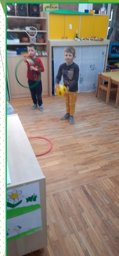
Vježbe s kolutima.