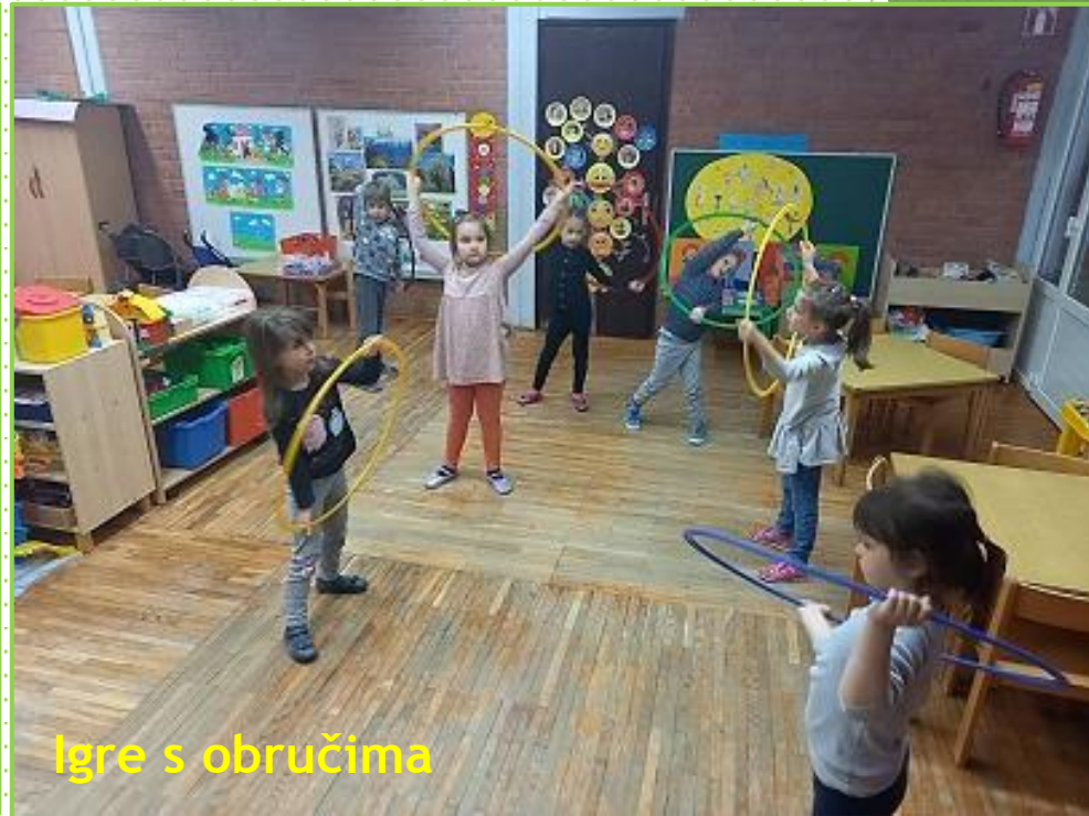
Igre s obručima