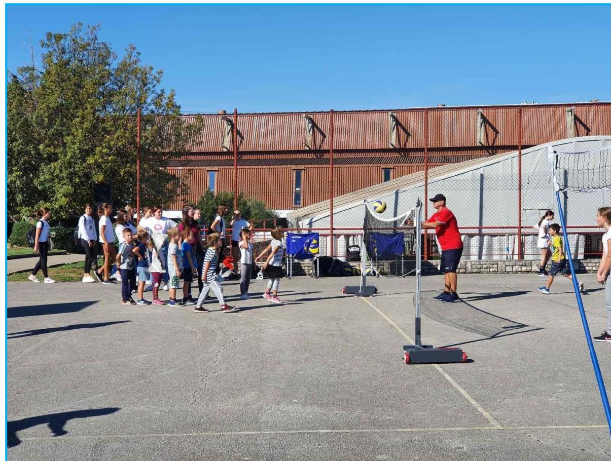
Prebacivanje lopte preko mreže.