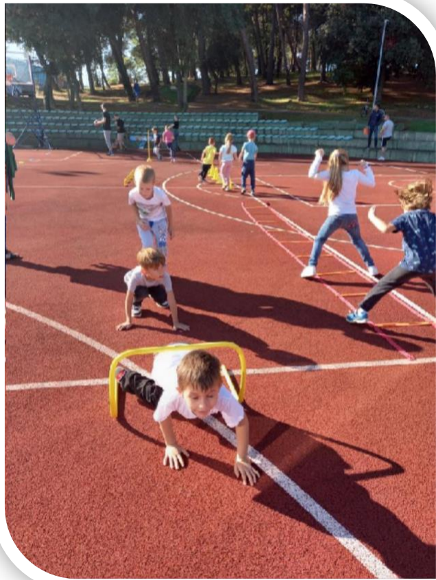
U aktivnostima su sudjelovala djeca odgojnih skupina DV „Radost I” - Soba 2 i Soba 6 i DV „Radost II” - Soba 3 i Soba 5