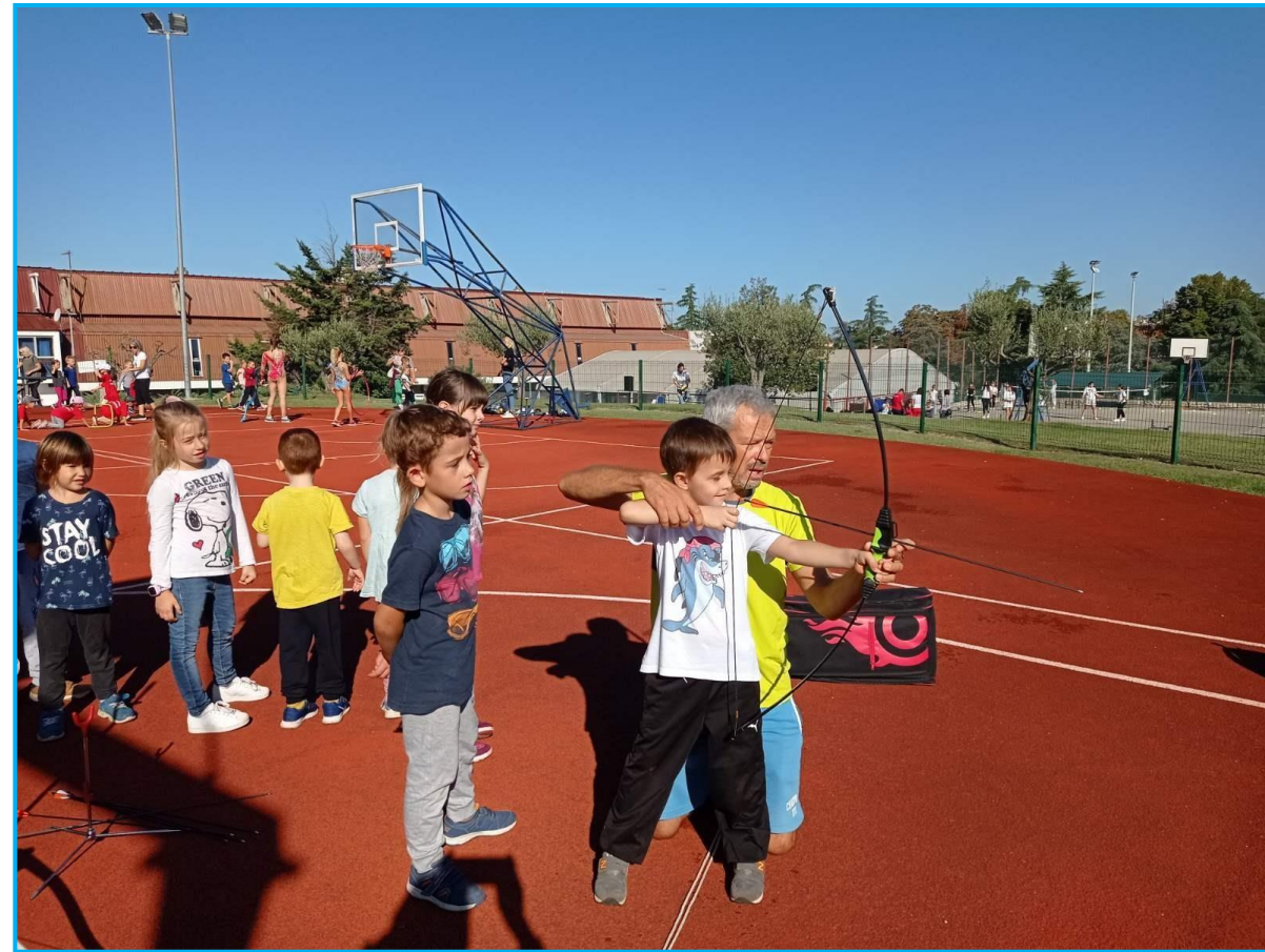
Preciznost i strpljivost na djelu !