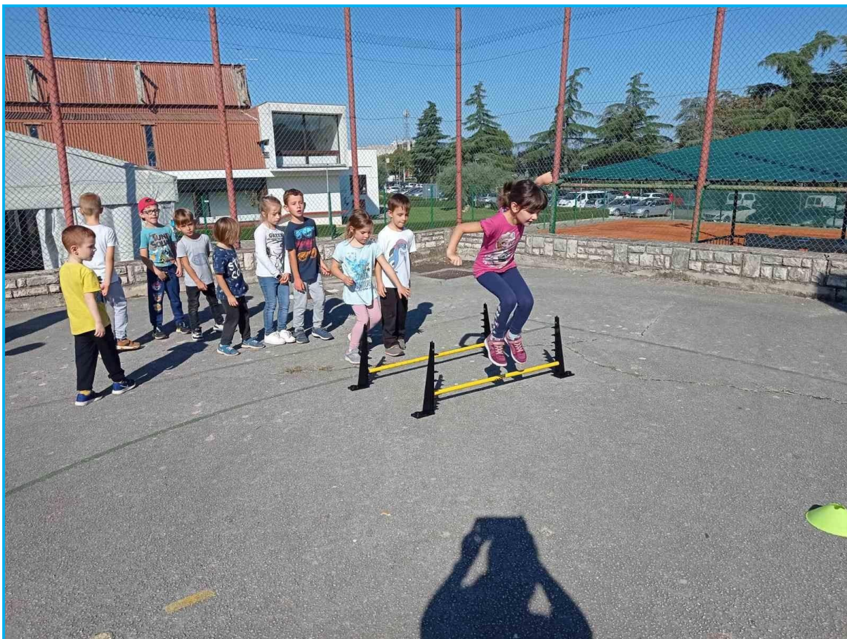
Motorička priprema za odbojku.