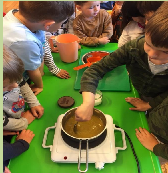
Gotov sirup ide na hlađenje