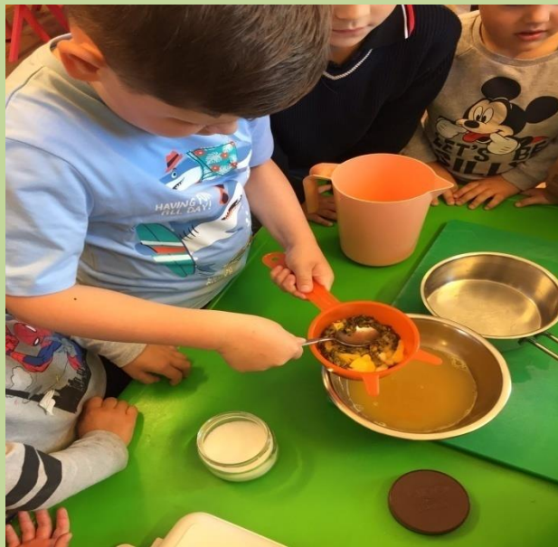
Sve sastojke smo dobro procijedili