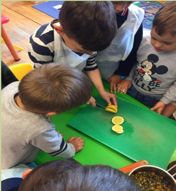
Izrezali smo limun