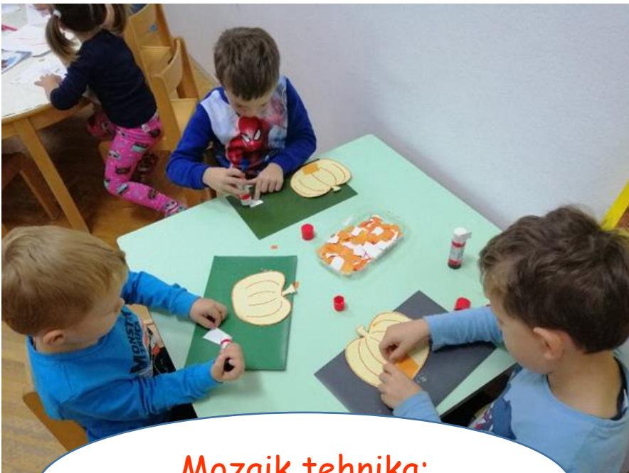
Mozaik tehnika: „Bundeva“