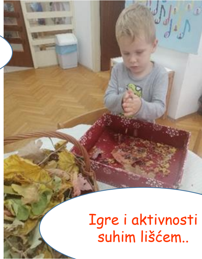
Igre i aktivnosti suhim lišćem..