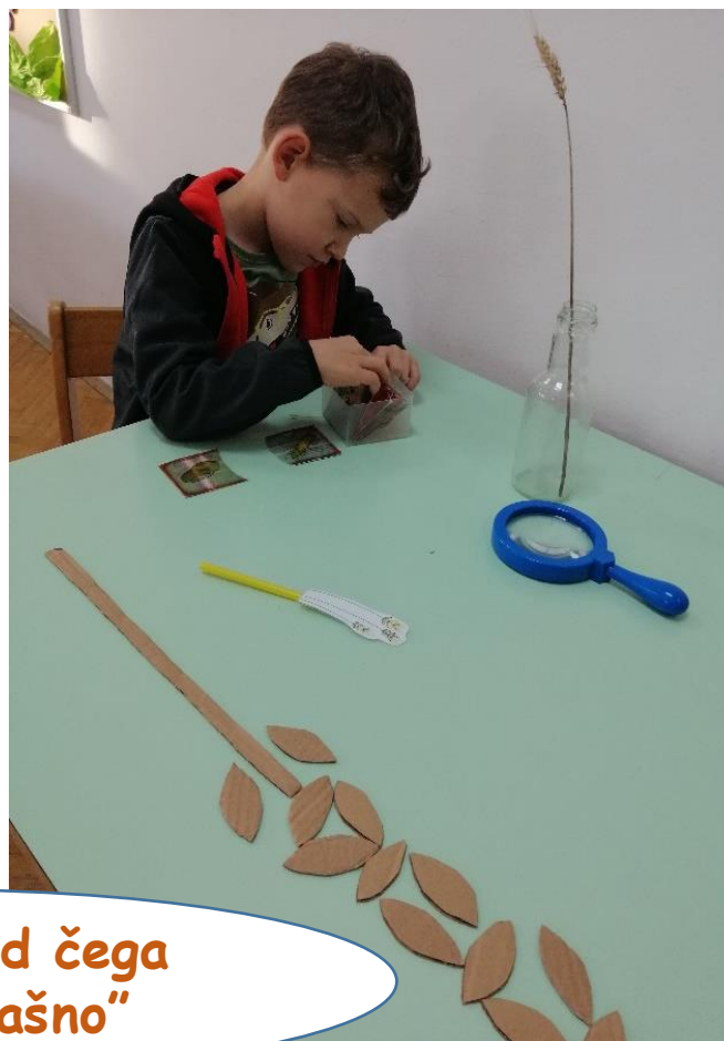
Slagalica „Od čega nastaje brašno“