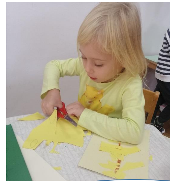
Kolaž tehnika-izrada klasa pšenice