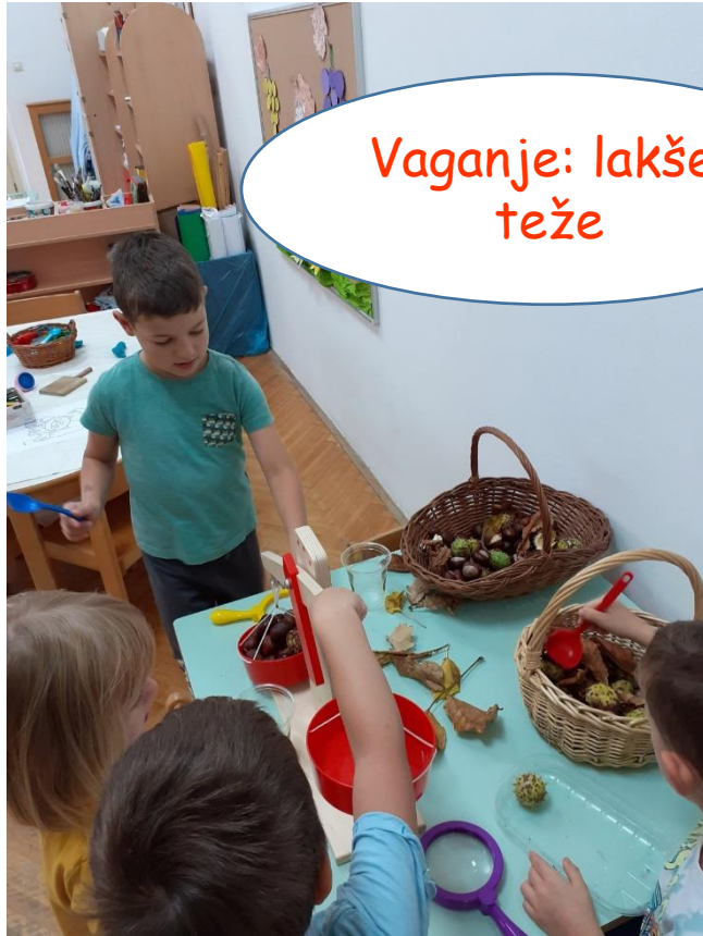
Vaganje: lakše, teže