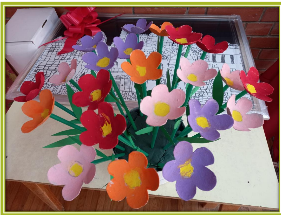
Izrađeni cvjetovi od papira s ispisanim porukama