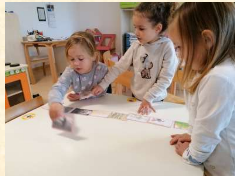
Igra „Redosljed radnji u priči.”