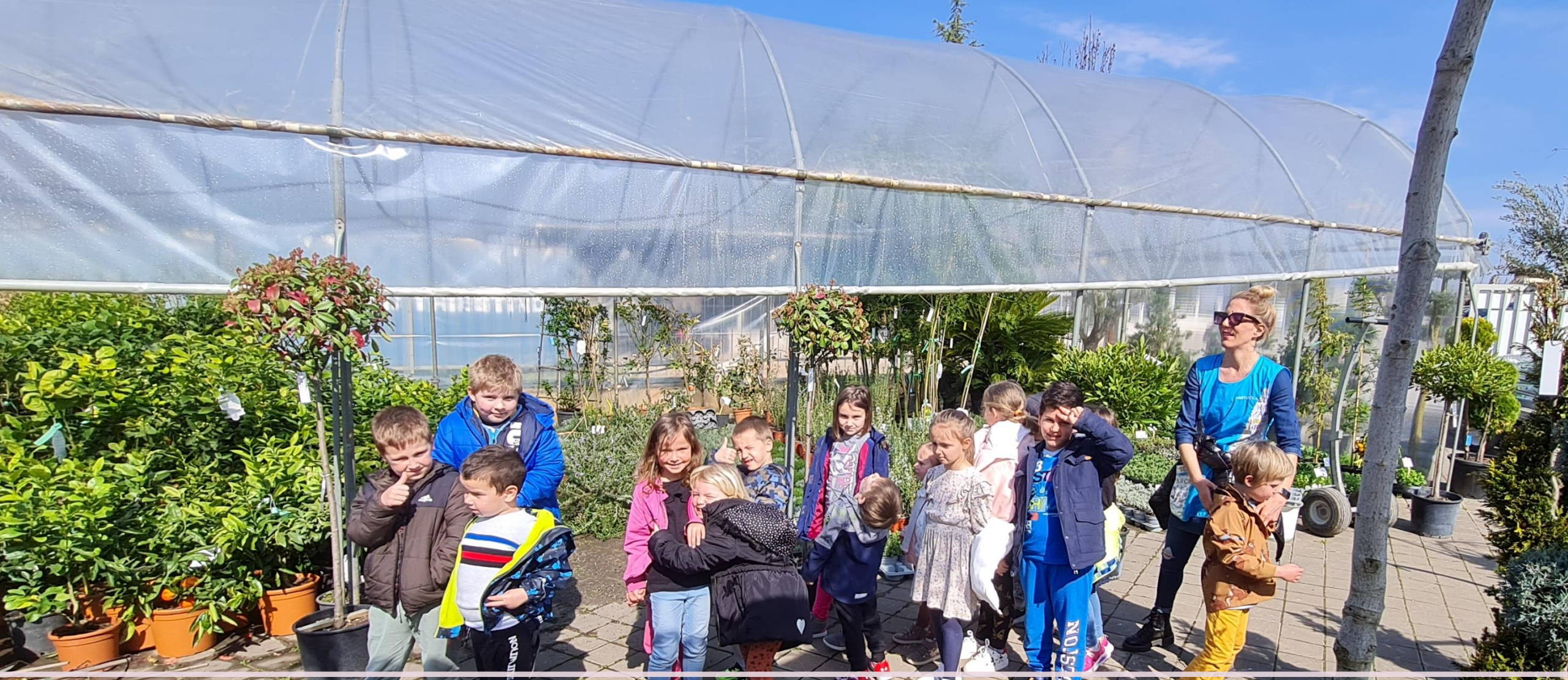
Posjet vrtnom centru Žbandaj