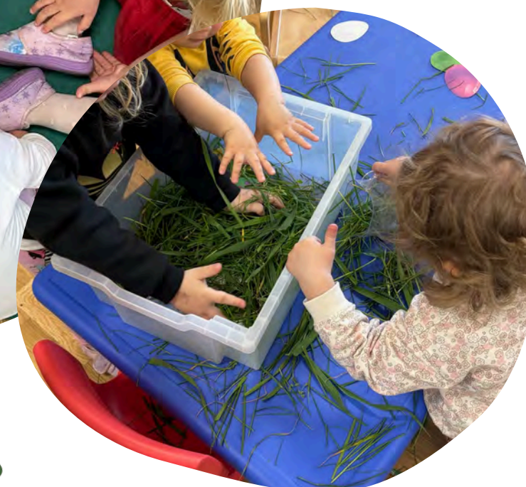
Igra prirodnim materijalima