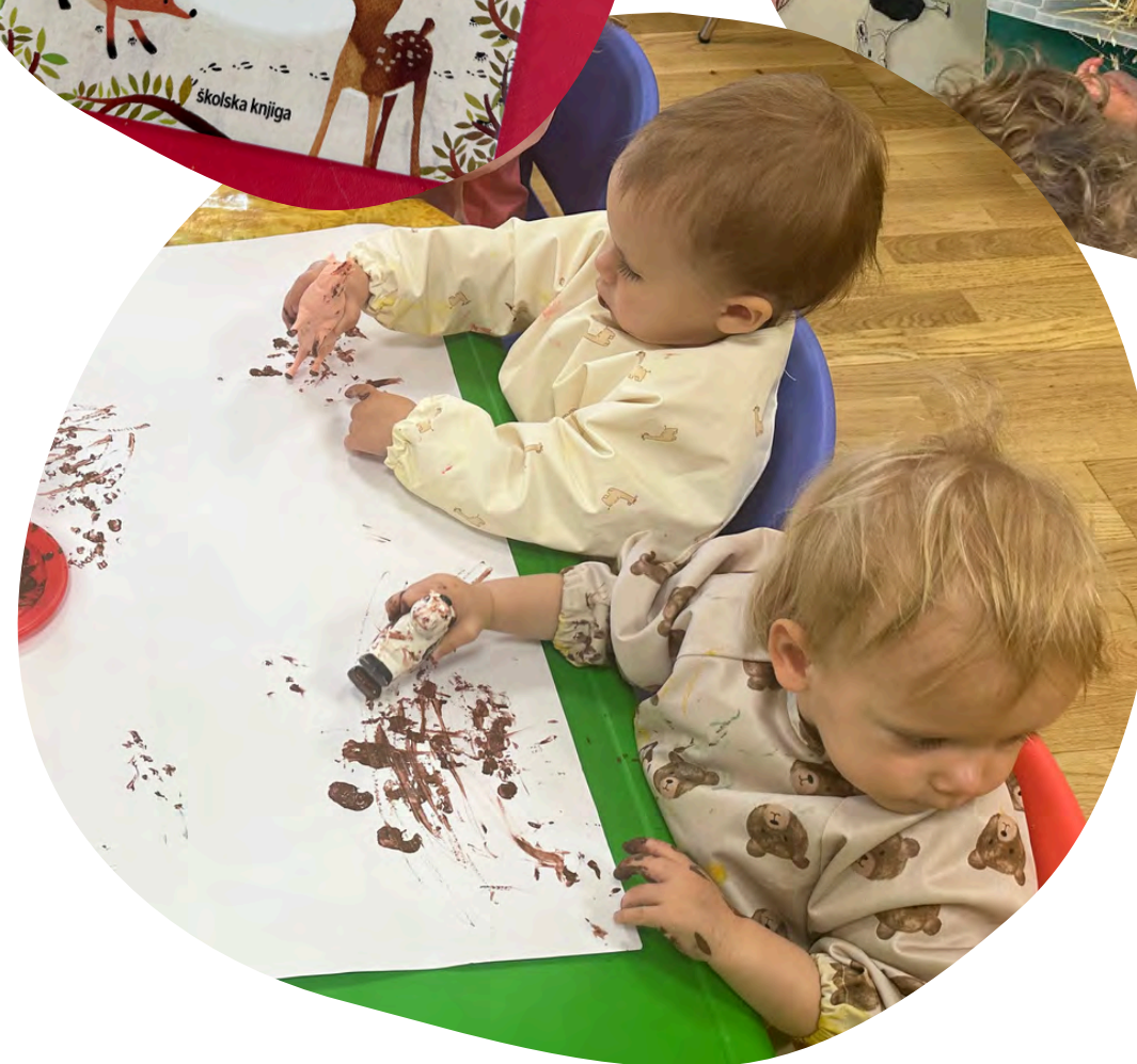
Aktivnost: "Čiji su ovo tragovi?"