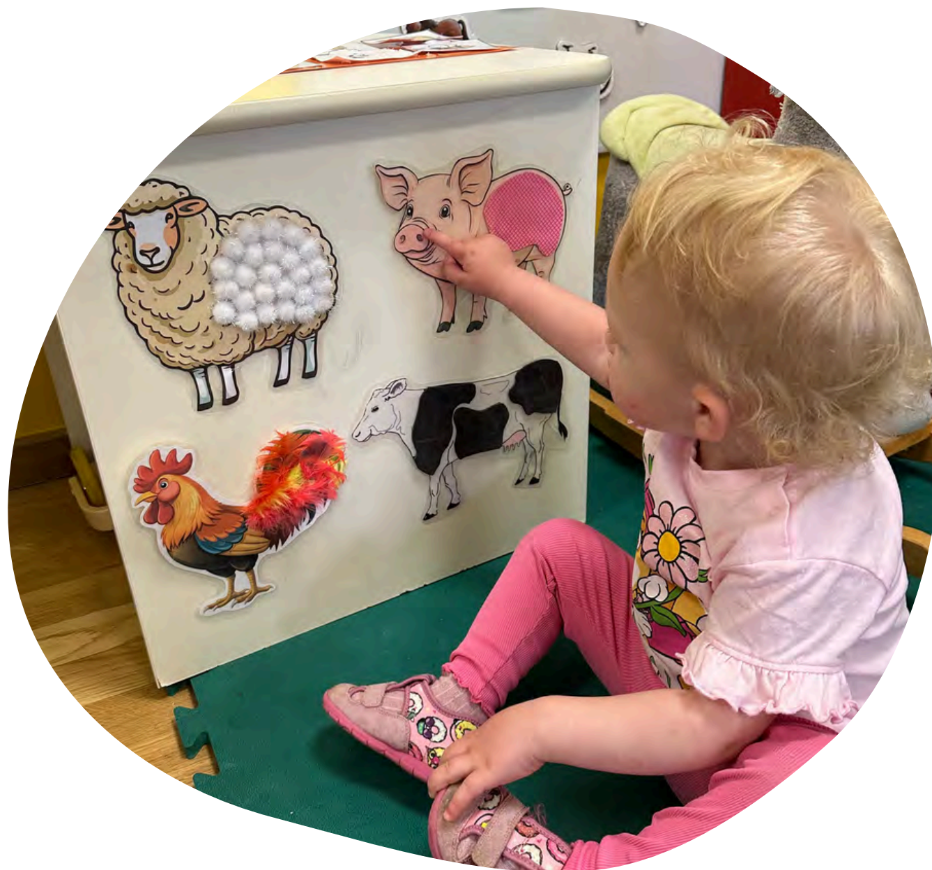
Aktivnost: "Senzorička ploča - Domaće životinje"