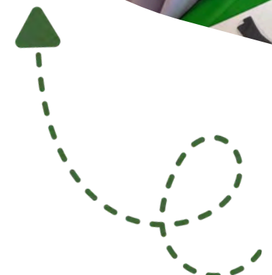
Pokrivaljka: "Domaće životinje"