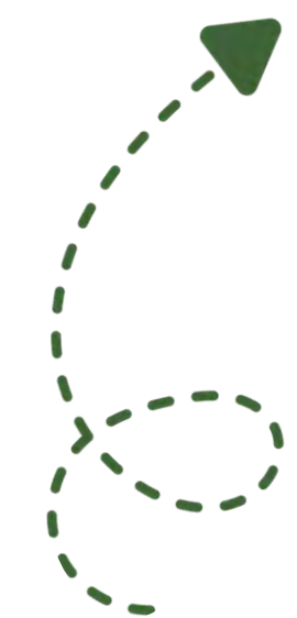
Pridruživanje odgovarajućem obliku