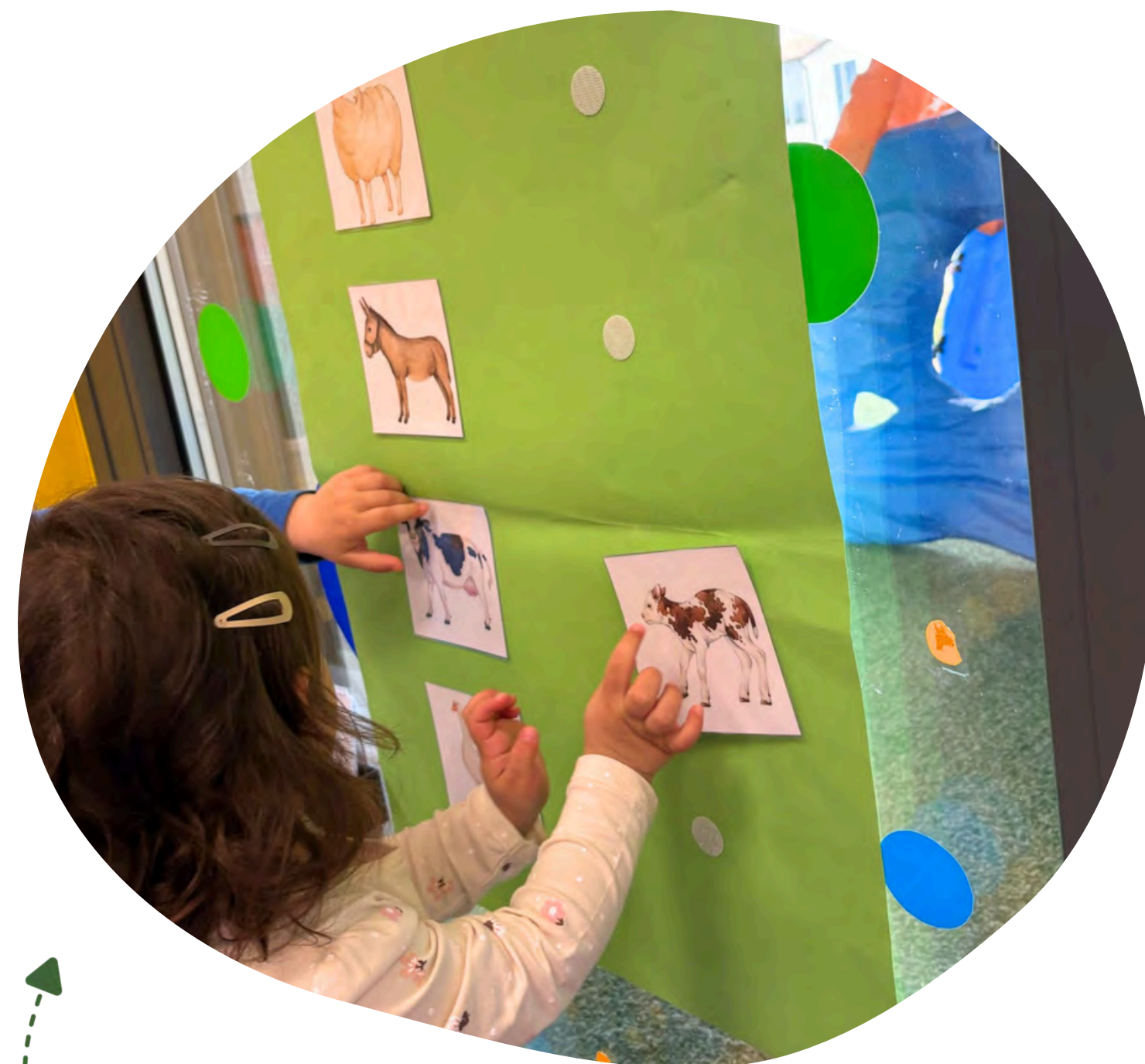
Aktivnost: "Nadi moju mamu"